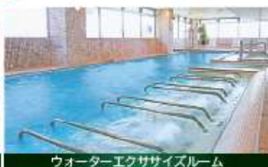
ウォーターエクササイズルーム