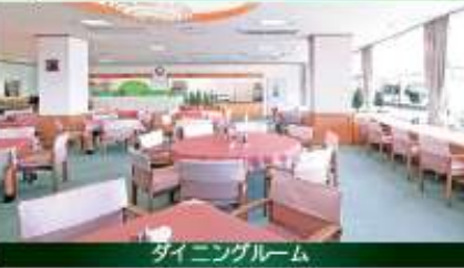
ダイニングルーム