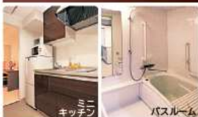
ミニキッチン(IH調理器)、冷暖房エアコン、浴室(ユニットバス)など