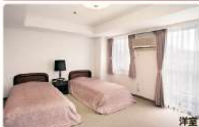
洋室 A～E各種タイプの専用居室をご用意しております。(32.31㎡～60.95㎡)