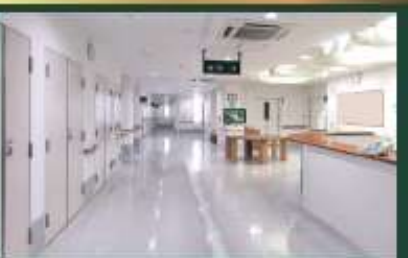
ナーシングホーム

ケアスタッフが24時間体制で常駐。将来、介護が必要になった場合も、利用者様の状態に応じた介護サービスをご提供します。