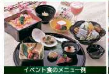
イベント食のメニュー例